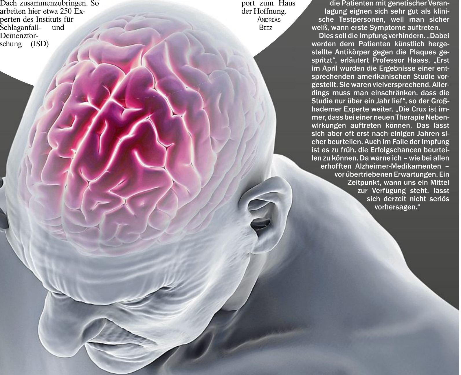
Gefahr fürs Gehirn: Schlaganfall und Demenz

Dies soll die Impfung verhindern. „Dabei werden dem Patienten künstlich hergestellte Antikörper gegen die Plaques gespritzt“, erläutert Professor Haass. „Erst im April wurden die Ergebnisse einer entsprechenden amerikanischen Studie vorgestellt. Sie waren vielversprechend. Allerdings muss man einschränken, dass die Studie nur über ein Jahr lief“, so der Großhaderner Experte weiter. „Die Crux ist immer, dass bei einer neuen Therapie Nebenwirkungen auftreten können. Das lässt sich aber oft erst nach einigen Jahren sicher beurteilen. Auch im Falle der Impfung ist es zu früh, die Erfolgchancen beurteilen zu können. Da warne ich – wie bei allen erhofften Alzheimer-Medikamenten – vor übertriebenen Erwartungen. Ein Zeitpunkt, wann uns ein Mittel zur Verfügung steht, lässt sich derzeit nicht seriös vorhersagen.“