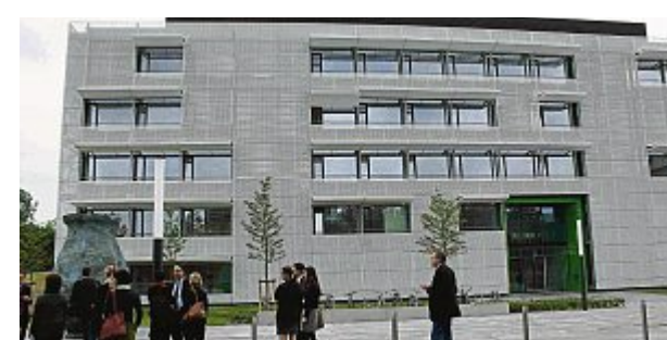
Am Universitätsklinikum Großhadern gibt es jetzt das neue Centrum für Schlaganfall- und Demenzforschung (CSD)

„Das CSD ist ein Musterbeispiel wissenschaftlicher Kooperation,“